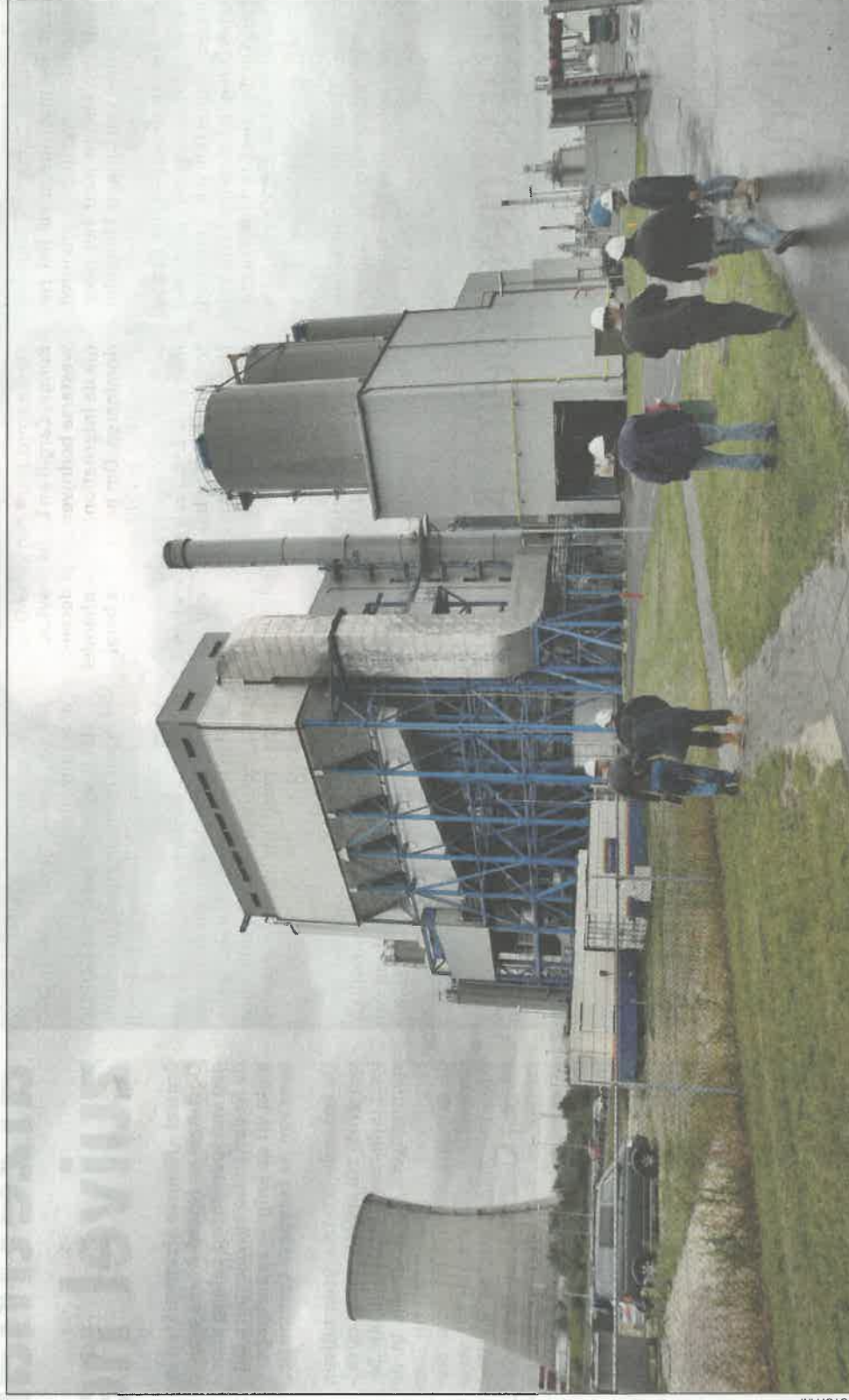
De mestcentrale BMC in Moerdijk. De centrale is de eerste op het Europese vasteland en de grootste ter wereld.

De pluimveemestverbranding is een soort drie-eenheid tussen de mestcentrale BMC Moerdijk, Coöperatie DEP (wat staat voor Duurzame Energieproductie Pluimveehouderij) en Orgafert BV. DEP is een coöperatie van nu zo'n 680 leden, allen pluimveehouders die hun mestoverschot leveren aan de coöperatie. Die levert die mest aan de verbrandingscentrale BMC Moerdijk of zet die elders af indien de mest